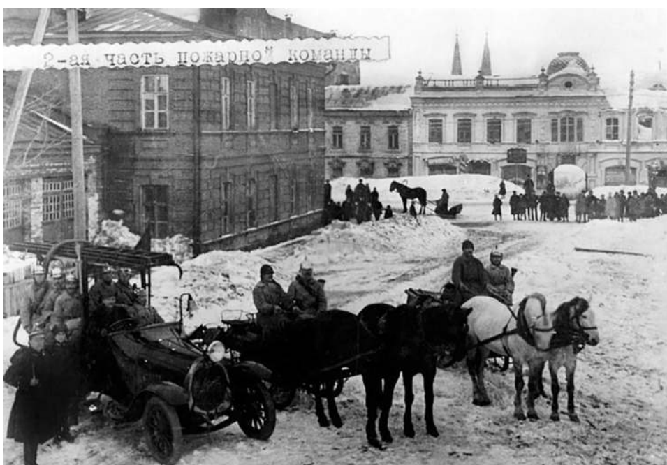
Пожарные 2-й части в Электрическом переулке на фоне домов Давыдова. Около 1927 г.

Главный дом усадьбы был построен довольно быстро. На снимке с каланчи Второй пожарно-полицейской части видно, что он уже вчерне готов, даже обвешан столярно-мебельной рекламой, но окна ещё не застеклены, и самое главное – нет купола по центру. Учитывая, что «Большая Сибирская» гостиница (ул. Александровская, 14) строилась, начиная с 1901 г., данный снимок для открытки могли сделать в том же году, ибо площадка для гостиницы только огорожена.