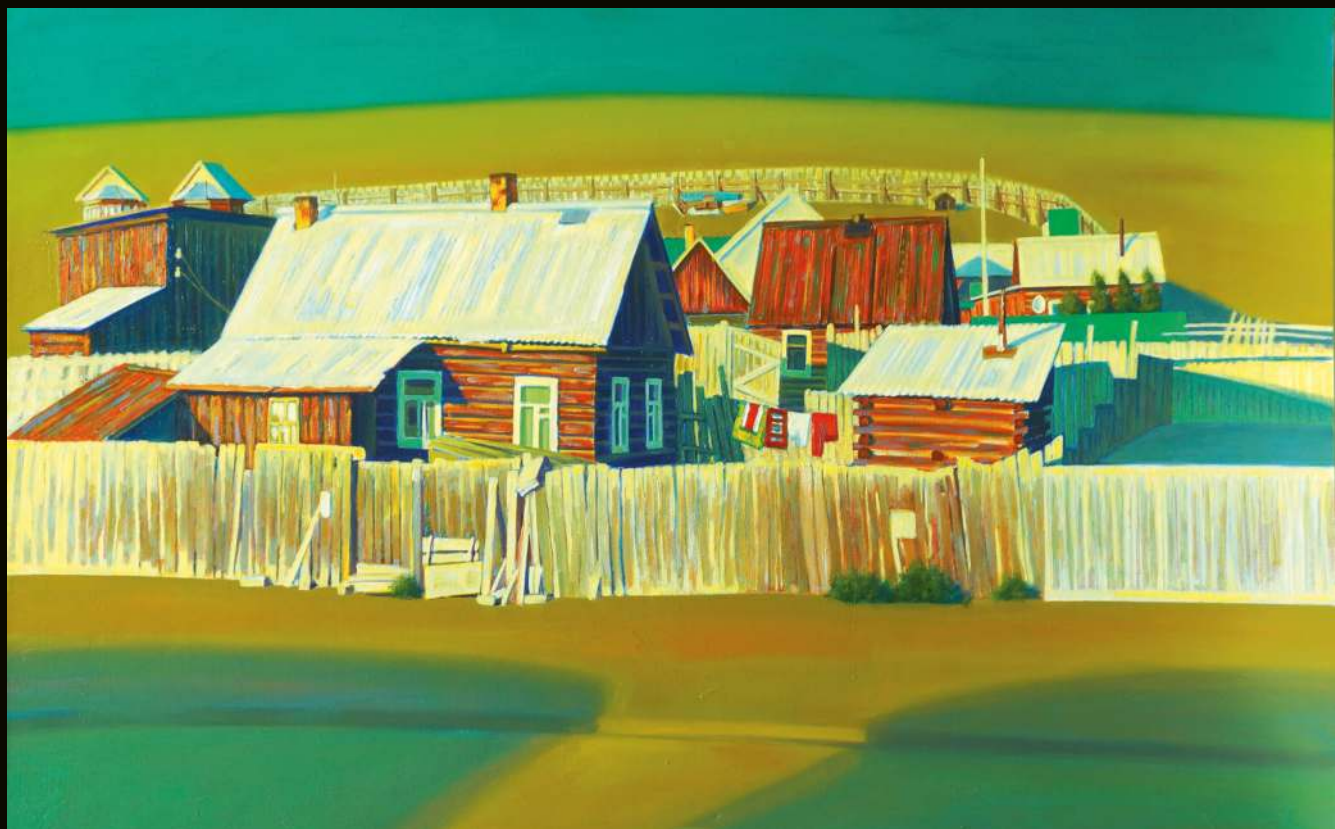
Виктор Рогачёв | Байкал, пос. Хужир. 80x120, холст, масло, 2024 г.