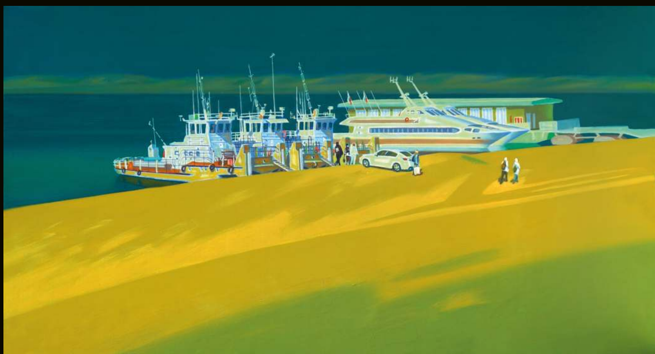
Виктор Рогачёв | Енисейск. Солнечный день. 70x130, холст, масло. 2022 г.