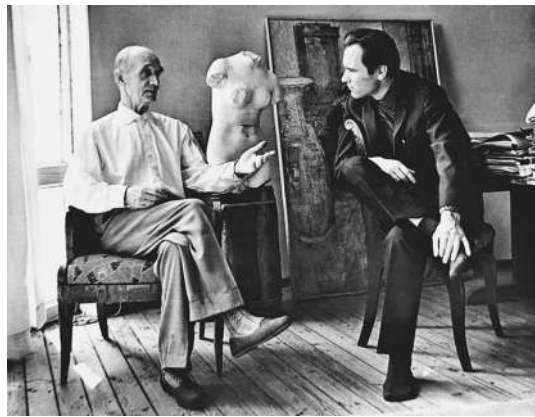
Беседа К.С. Мельникова и В.М. Шукшина в доме в Кривоарбатском переулке. 1973 год