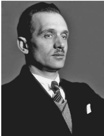
Константин Степанович Мельников (1890–1974)

ре: каким он был в жизни, о чем мечтал, что не успел сделать. И каково же было удивление молодого французского журналиста, услышавшего неожиданный ответ на свой вопрос: «Да вы у него самого спросите!» «А разве господин Мельников жив?» Да, Константин Степанович Мельников (1890–1974) встречал свой юбилей в здравом уме и ясной памяти в собственном доме в Кривоарбатском переулке. В 1965 году, минуя защиту диссертации, ему к 75-летию присвоили ученую степень доктора архитектуры, а за два года до смерти, в 1972 году, наградили званием заслуженного архитектора РСФСР... В России надо жить долго. Звание дали, вот бы еще здоровьем кто поделился. А силы и творческие помыслы остались в далеком, довоенном прошлом.