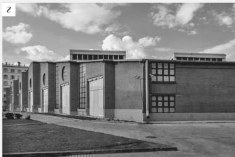
Примеры зданий в Москве, выполненных по проектам К.С. Мельникова: а — гараж Госплана СССР, б — гараж Интуриста, в — клуб фабрики «Свобода», г — Бахметьевский гараж

А самое главное наследство Мельникова — это собственный дом в Кривоарбатском переулке (1927–1929), ибо здесь он выступал в двух и даже трех лицах: заказчика, архитектора и жителя. Это, наверное, было и просто, и трудно одновременно. Тот факт, что Мельников жил в спроектированном им же доме, не редкость даже для Москвы, ибо это считалось даже в порядке вещей. Взять хотя бы знаменитого Федора Шехтеля, который вполне мог позволить себе подобное — жить в своем же доме. Но это было до 1917 года, когда право частной собственности никто не отменял. В советское же время подавляющее большинство зодчих могло рассчитывать на всего лишь квартиру, например, в высотном доме, ими же спроектированном (например, Дмитрий Чечулин жил в сталинской высотке на Котельнической набережной), но Мельников-то получил право выстроить личный дом. Как же это стало возможным?